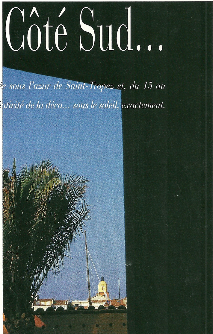
SALON VIVRE CÔTÉ SUD, ESPLANADE DU PORT, SAINT-TROPEZ

des paillotes de plage où siroter des vitamines... Sans oublier la fraîcheur de la maison Côté Sud et d'un restaurant plus sixties que nature. Des enseignes célèbres, de jeunes créateurs et artisans de talent, un marché de saveurs avé l'assen et bien sûr, un troisième Grand Prix du Livre, voilà déjà un programme épatant. Mais aussi pour la première fois, une vente aux enchères sera menée par M e Pierre Cornette de Saint-Cyr le samedi 16 juin à 18 heures. De plus, pendant toute la durée du salon, le stand Collecties offrira une expertise gratuite à tout visiteur désireux de faire estimer un objet ou une antiquité, certificat garanti pour trente ans à l'appui. Alors n'oubliez pas de noter sur vos agendas : le week-end des 16 et 17 juin, le salon sera ouvert au public ; quelle superbe occasion de s'évader pour une balade à Saint-Tropez !